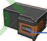
Tête d'impression (ne pas tremper toute la cartouche)

Il vous faudra dans un premier temps nettoyer les têtes d'impression de vos cartouches en vous aidant de notre solvant spécial. Dans la mesure où vous n'en auriez pas, utilisez plutôt de l'eau distillée. A noter qu'il vous faudra faire tremper uniquement la tête d'impression dans une petite coupelle remplie de liquide et non la cartouche entière.